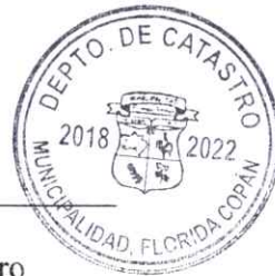
Edwin Ramos Coordinador de Catastro

Total Facturas No Pagadas: 0.00 Total Facturas Pagadas: 400.00 Total Facturas en Tesorería: 0.00 Total Facturas Anuladas: 0.00