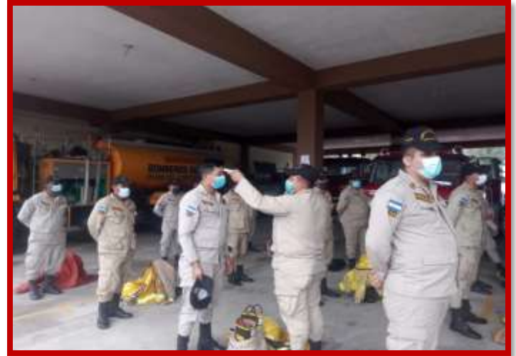
Revisión de las unidades de emergencia y toma de temperatura al personal como medida de prevención del COVID19