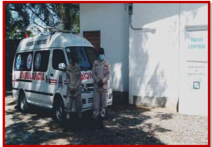
Traslado de paciente a centro médico y prevención, seguridad Humanitaria y servicio de ambulancia para trasladar pacientes sospechosos de COVID19 en el triaje central.