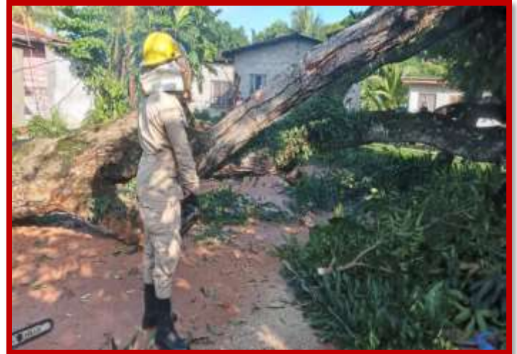
Corte y fragmentación de árbol caído en B° Pueblo Nuevo