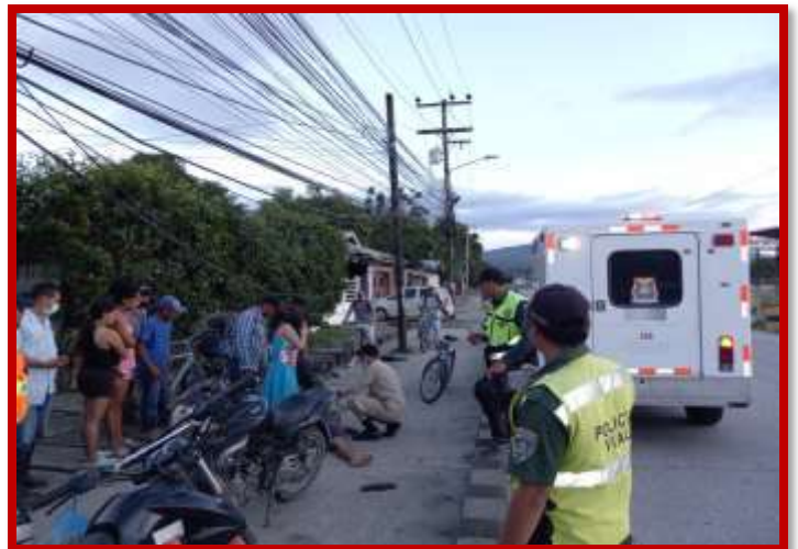
Traslado de paciente a centro médico y atención en accidente de motocicleta y posterior traslado a centro hospitalario.