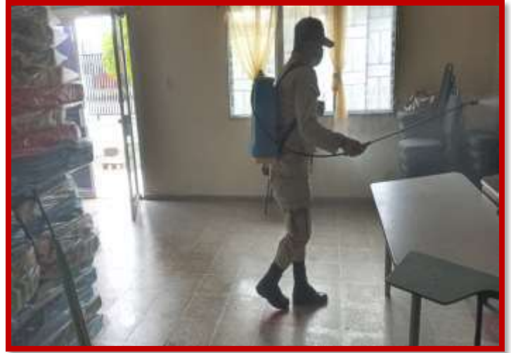
Sanitización de las instalaciones Bomberiles como medida de prevención de COVID19.