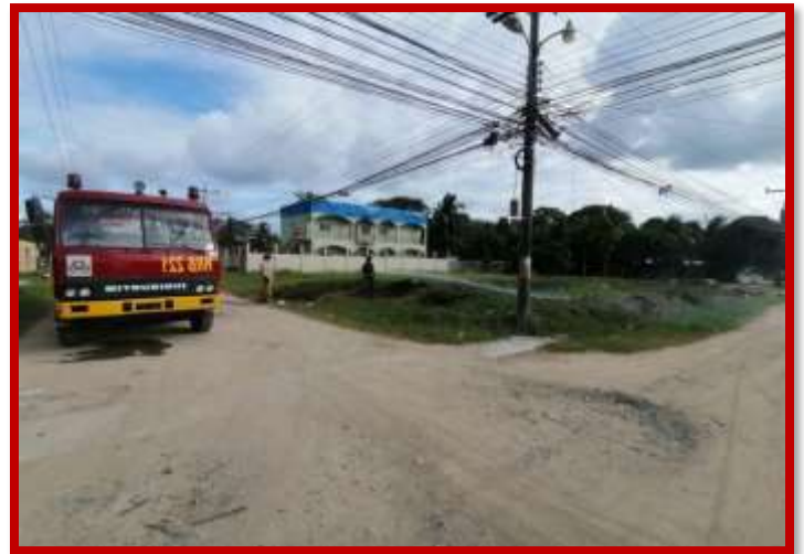
Control y extinción de incendio en basurero en B° San Isidro