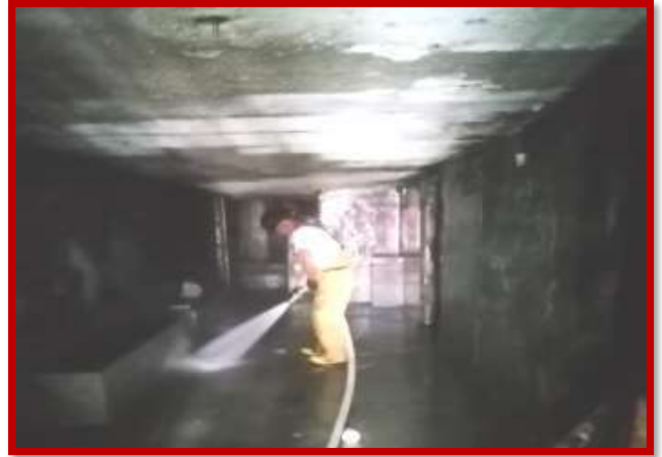
Labor social en lavado de Celdas de la Policía Nacional.