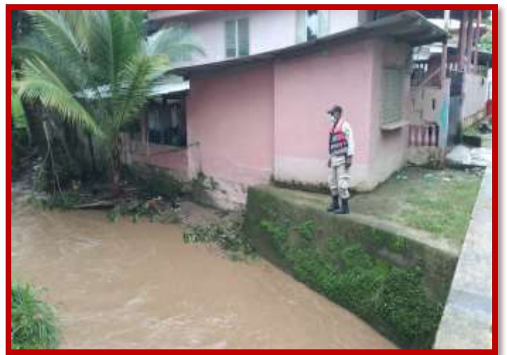
Inspecciones en diferentes partes de la ciudad susceptibles a inundación.