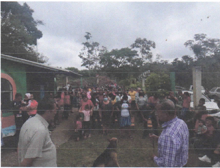
Elección Patronato Las Americas