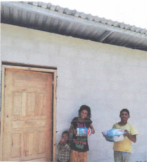
Supervisión Entrega de Casas Proyecto Convenio