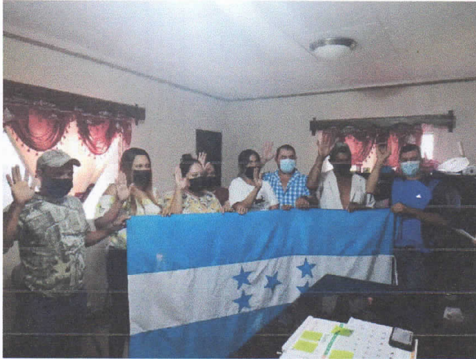
Juramentación Patronato Planes de Italia