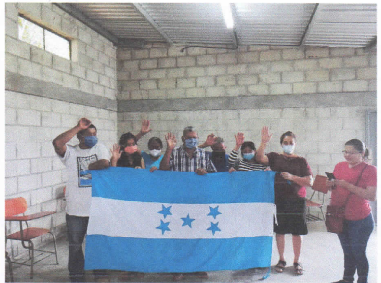
Juramentación Patronato La Música