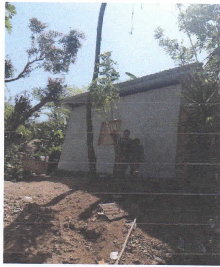
Supervisión Casas Construidas con convenio