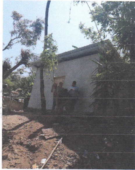
Supervisión Casas Construidas convenio