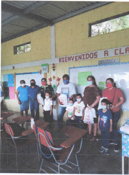
Entrega de Útiles comunidad La Másica gestión Alcalde Municipal con apoyo Fundación Fiel