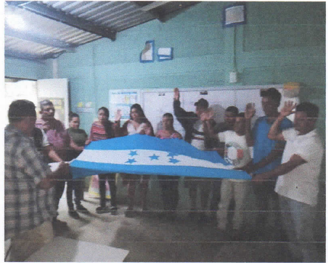
Elección y Juramentación