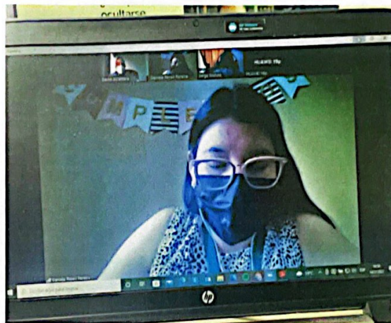
Tema "Permiso de Pequeña Minería y Minería Artesanal" Municipalidad de San Esteban Olancho, Olancho (02-02-2022).