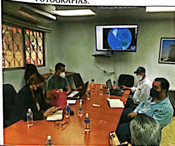
Tema "Proceso de Concesionamiento" CONHSA-PAYSA, San Pedro Sula, Cortes., (07-2-2022).