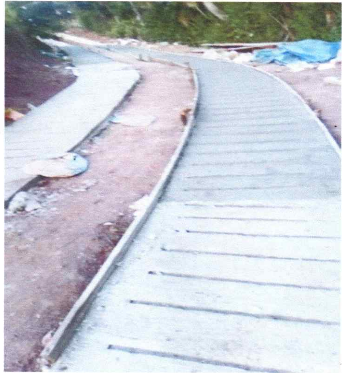
Huellas las huertas