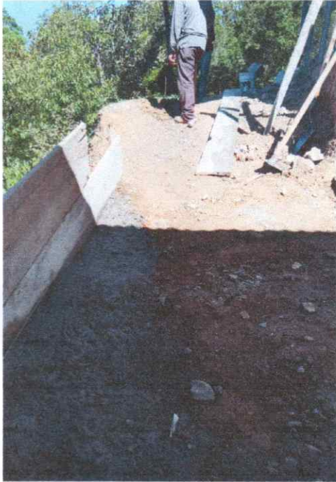
Fundición de camino Juncales