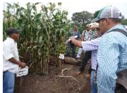
Días de campo en validación de Sorgo