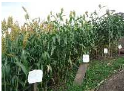
Validación de Sorgo