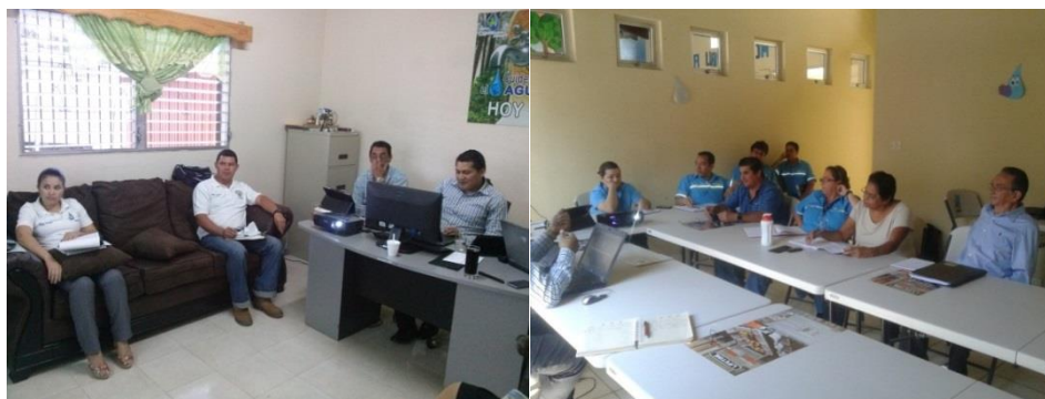
Socialización en las oficinas de la Gerencia de AdS.