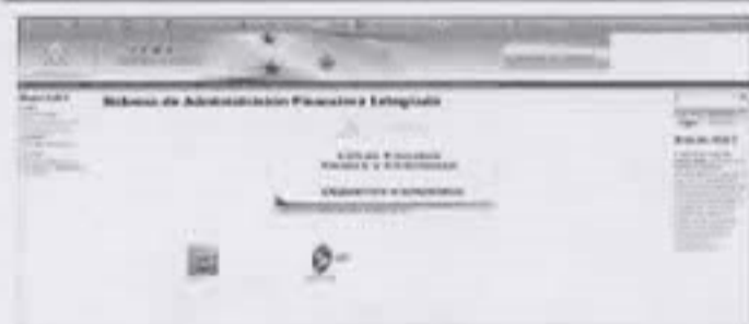
Siafi al cierre de febrero 2016.JPG 99K