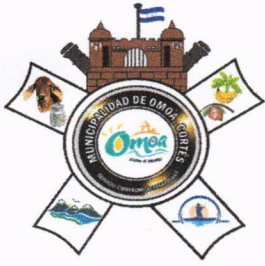
Escudo de Armas