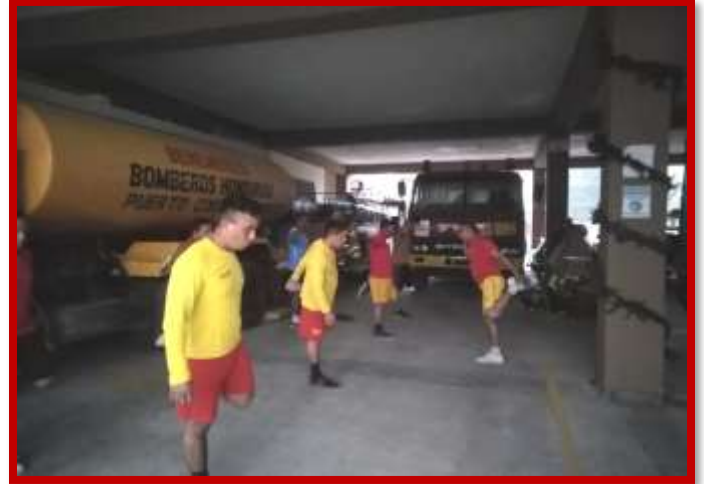
Toma de temperatura corporal al personal para prevención del covid19 y practica de ejercicios físicos para mantener condición física