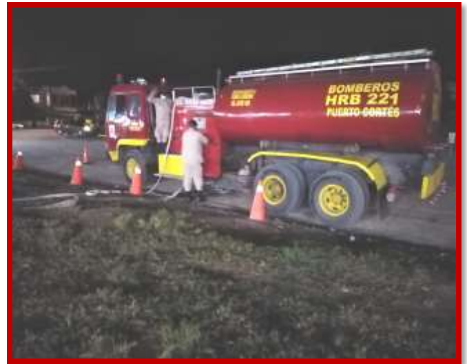
Suministro de agua a barriles ubicados en puesto temporal de venta de pólvora autorizada, ubicados en predios de la municipalidad