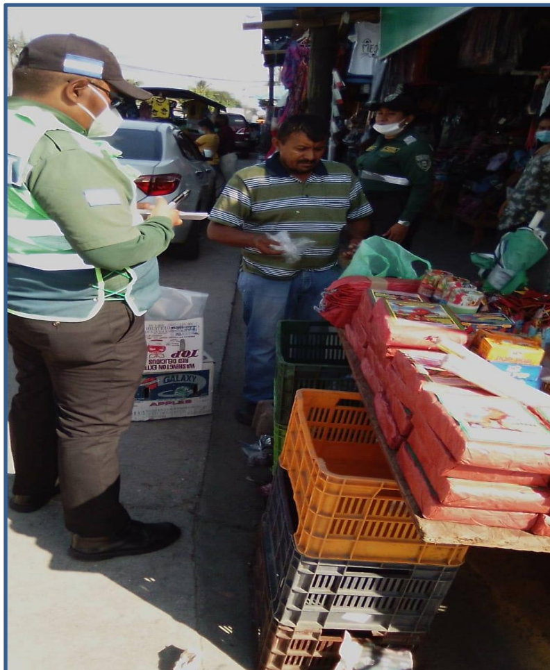
OPERATIVOS DE SEGURIDAD Y CONTROL DENTRO DEL MUNICIPIO