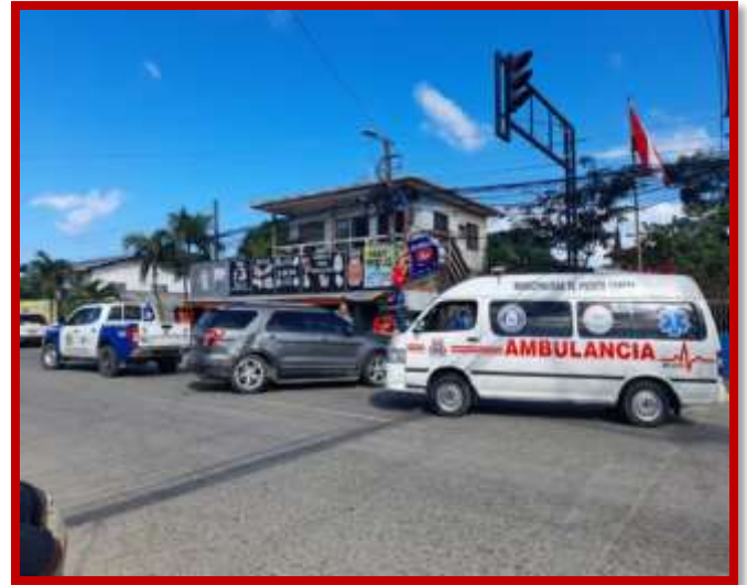
Atención pre hospitalaria en accidentes y traslado inmediato a centros de atención pública y/o privada