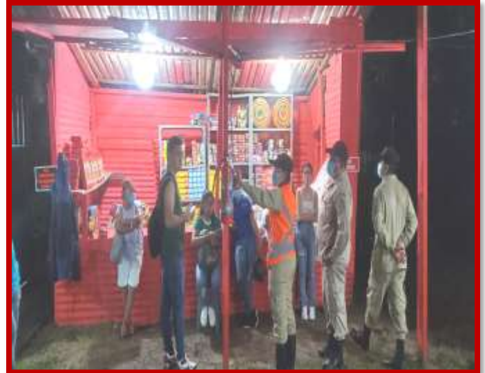
Inspecciones, Prevención y seguridad en los puestos de venta de pólvora autorizada en los predios de la municipalidad