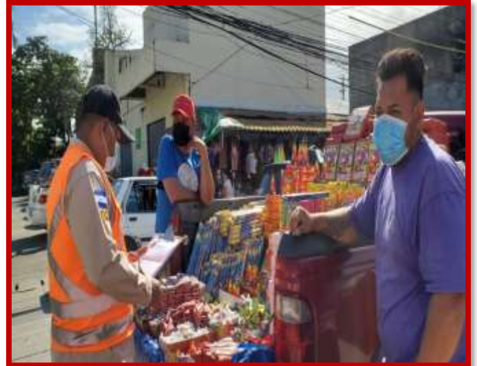
Inspecciones en establecimientos comerciales y espacios públicos en cumplimiento del operativo navideño