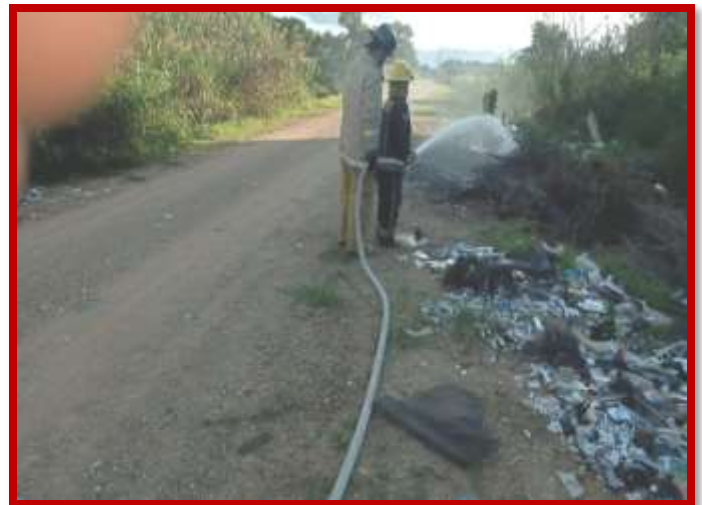
Control y extinción de desechos solidos en via publica del barrio el faro