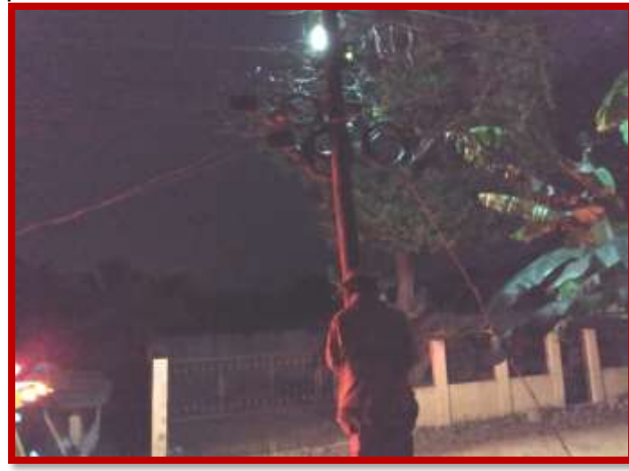
Control de falla eléctrica en tendido de alumbrado publico