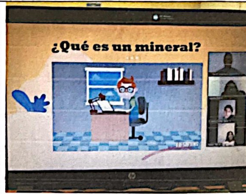
Tema “Pequeña Minería y Minería Artesanal, EITI, Resolución de Conflictos” Municipalidad de Ocotepeque. Ocotepeque. (03-11-2021).