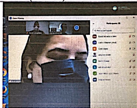
Tema “Declaración Anual Consolidada” Empresa Concesionaria Santos y Compañía Comayagüela MDC. Francisco Morazán (12-11-2021).