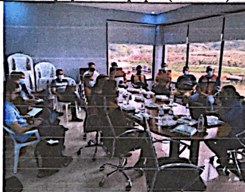
Tema “Pequeña Minería y Minería Artesanal, EITI” Municipalidad de San Matías. El Paraíso. (16-07-2021).