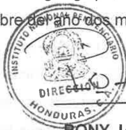
RONY JAVIER PORTILLO DIRECTOR NACIONAL INSTITUTO NACIONAL PENITENCIARIO

Dado en la ciudad de Tegucigalpa, Municipio del Distrito Central, quince (15) días del mes de noviembre del año dos mil veintiuno (2021).