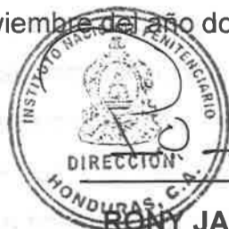
RONY JAVIER PORTILLO DIRECTOR NACIONAL INSTITUTO NACIONAL PENITENCIARIO

Dado en la ciudad de Tegucigalpa, Municipio del Distrito Central, diecinueve (19) días del mes de noviembre del año dos mil veintiuno (2021).