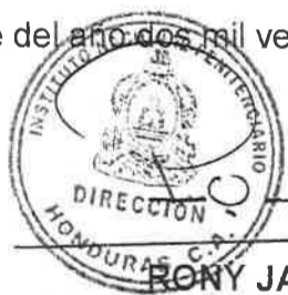
RONY JAVIER PORTILLO DIRECTOR NACIONAL INSTITUTO NACIONAL PENITENCIARIO

Dado en la ciudad de Tegucigalpa, Municipio del Distrito Central, doce (12) días del mes de noviembre del año dos mil veintiuno (2021).