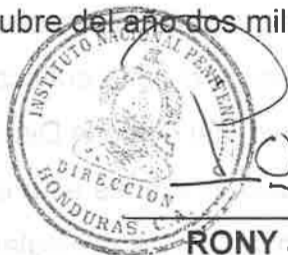
RONY JAVIER PORTILLO DIRECTOR NACIONAL INSTITUTO NACIONAL PENITENCIARIO

Dado en la ciudad de Tegucigalpa, Municipio del Distrito Central, dieciocho (18) días del mes de octubre del año dos mil veintiuno (2021).