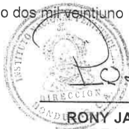
RONY JAVIER PORTILLO DIRECTOR NACIONAL INSTITUTO NACIONAL PENITENCIARIO

Dado en la ciudad de Tegucigalpa, Municipio del Distrito Central, a los veinte (20) días del mes de agosto del año dos mil veintiuno (2021).