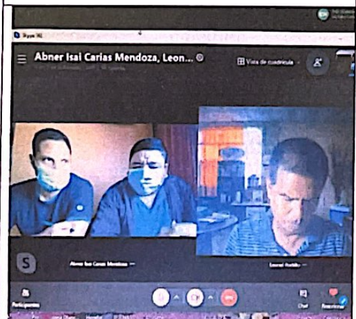
Tema "Pequeña Minería y Minería Artesanal, EITI" Municipalidad de San Francisco del Valle. Ocotepeque. (19-10-2021).