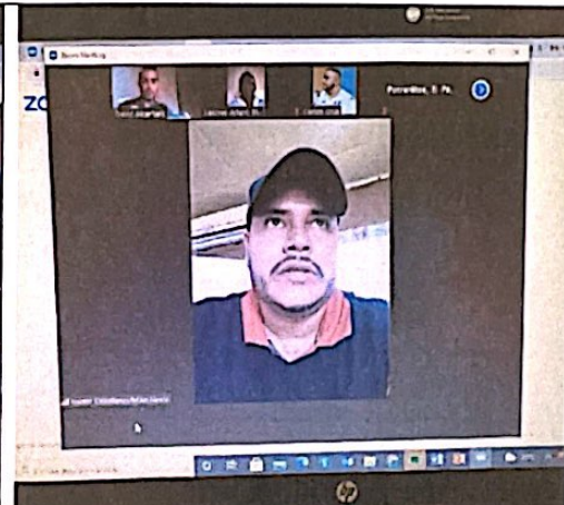
Tema "Pequeña Minería y Minería Artesanal, EITI" Municipalidad Potrerillos. El Paraíso. (13-10-2021).