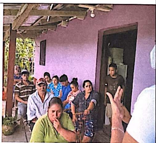
Tema "Formación de Micro-Empresas bajo la Ley del Sector Social de la Economía" Grupo de Artesanos de Arcilla Alfareros de Guarisme, Ojojona, Francisco Morazán, (26-10-2021).