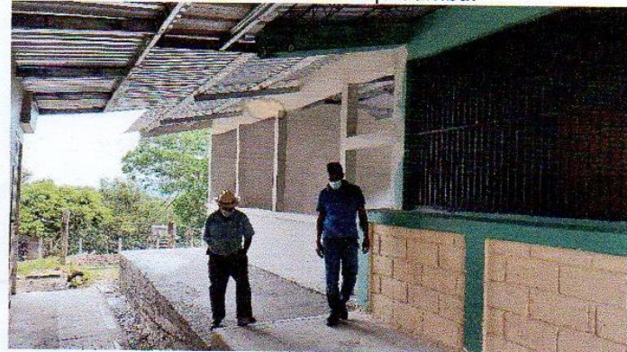
Construcción modulo escolar esc. Lagunetas