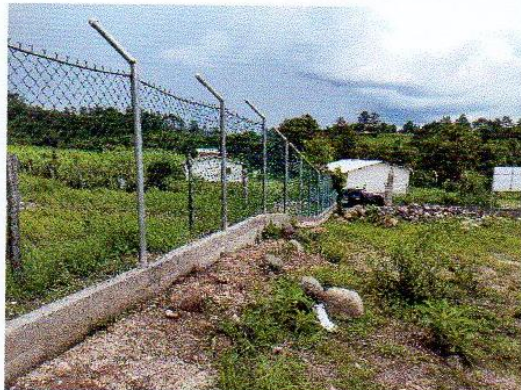
Construcción cerca esc. La Jagua