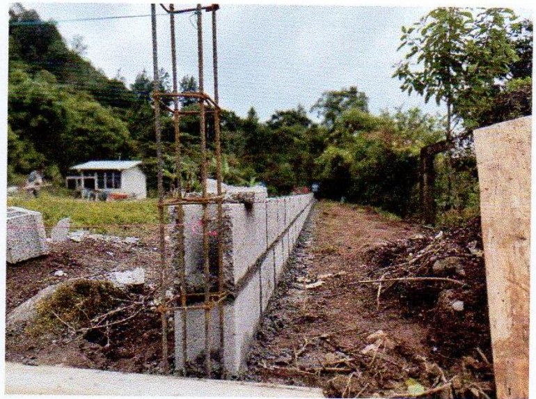
Construcción cerca esc. El Liquidambal