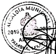
Josué René Melgar Ramos Alcalde Municipal Tambla Lempira

Horario de Atención: lunes a viernes de 8:00 am – 12:00 pm y de 1:00 pm – 4:00 pm.