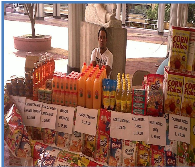
Feria Consumo lo Nuestro en las instalaciones del Congreso Nacional