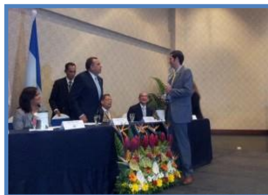
Empresas exportadoras galardonadas.