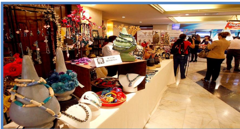
Los empresarios mostraron parte de los productos que exportan a otros países.