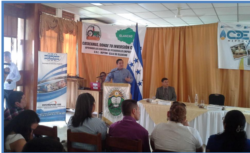
Lanzamiento del Centro de Desarrollo Empresarial CDEMIPYME Valle de Olancho