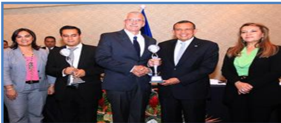
Ganadora del Premio Presidencial al Exportador 2013, mérito que recayó en el Beneficio Santa Rosa.