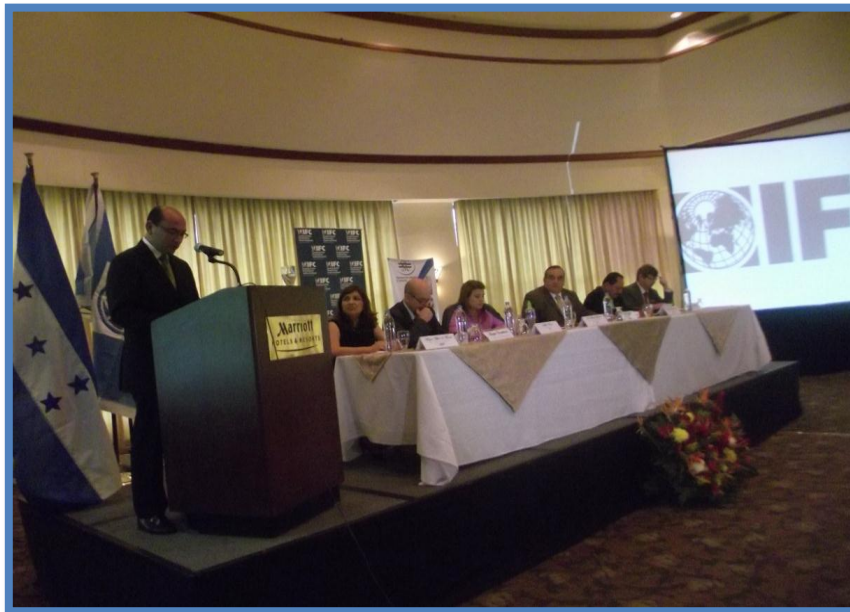
Ministro de Industria y Comercio José Adonis Lavaire en el lanzamiento del Sistema Electrónico de Comercio Exterior de Honduras (SECEH).