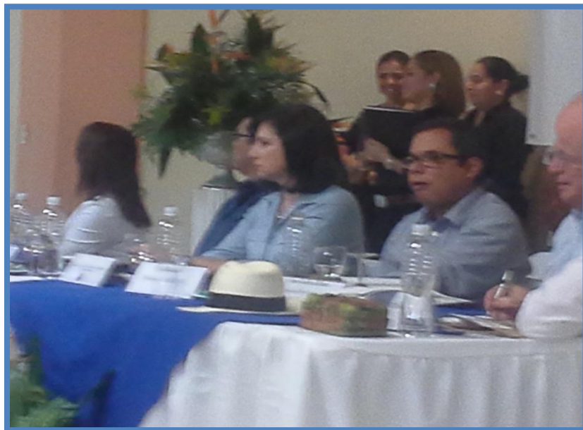
Lanzamiento del Centro de Desarrollo Empresarial CDEMIPYME Golfo de Fonseca