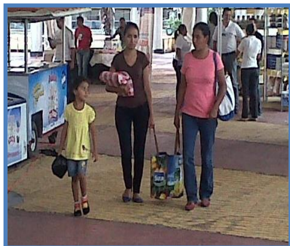
Feria Consumo Lo Nuestro realizada en Nacaome, Valle