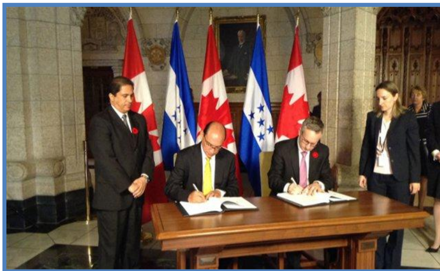
El ministro canadiense de Comercio, Ed Fast, y su homólogo hondureño José Lavaire, firmaron el acuerdo en un acto desarrollado en Ottawa.