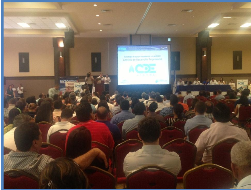
Lanzamiento del Centro de Desarrollo Empresarial CDEMIPYME Valle de Sula