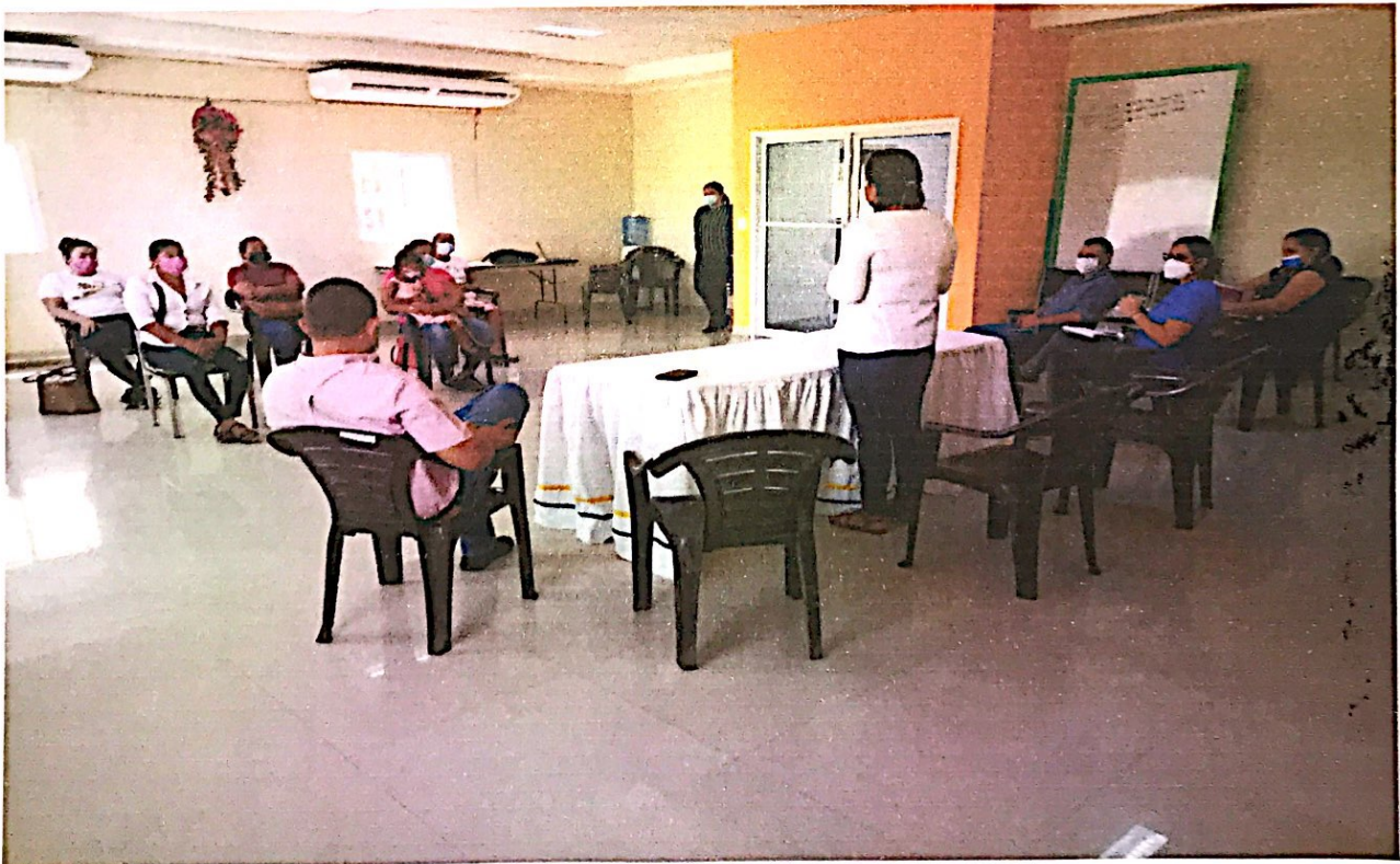
OFICINA MUNICIPAL DE LA MUJER