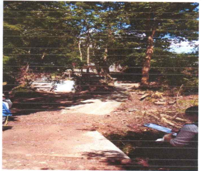
Vado N° 2