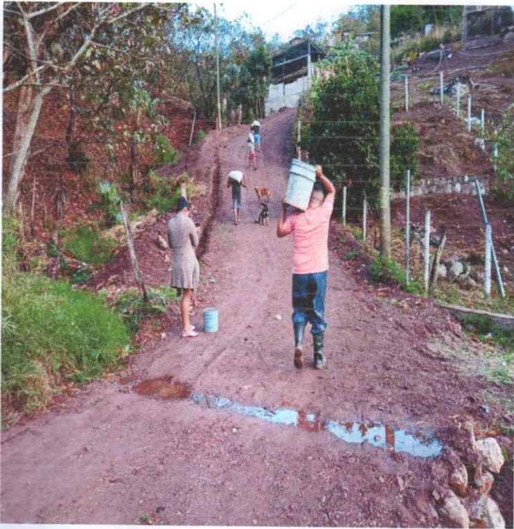
Fundición de vado y calle las Uvitas