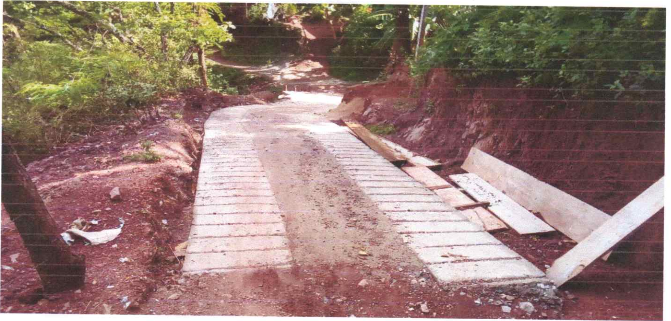
Fundición de Vado N°4