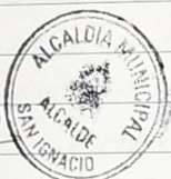
Simón Arany Hidalgo Regidor # 1