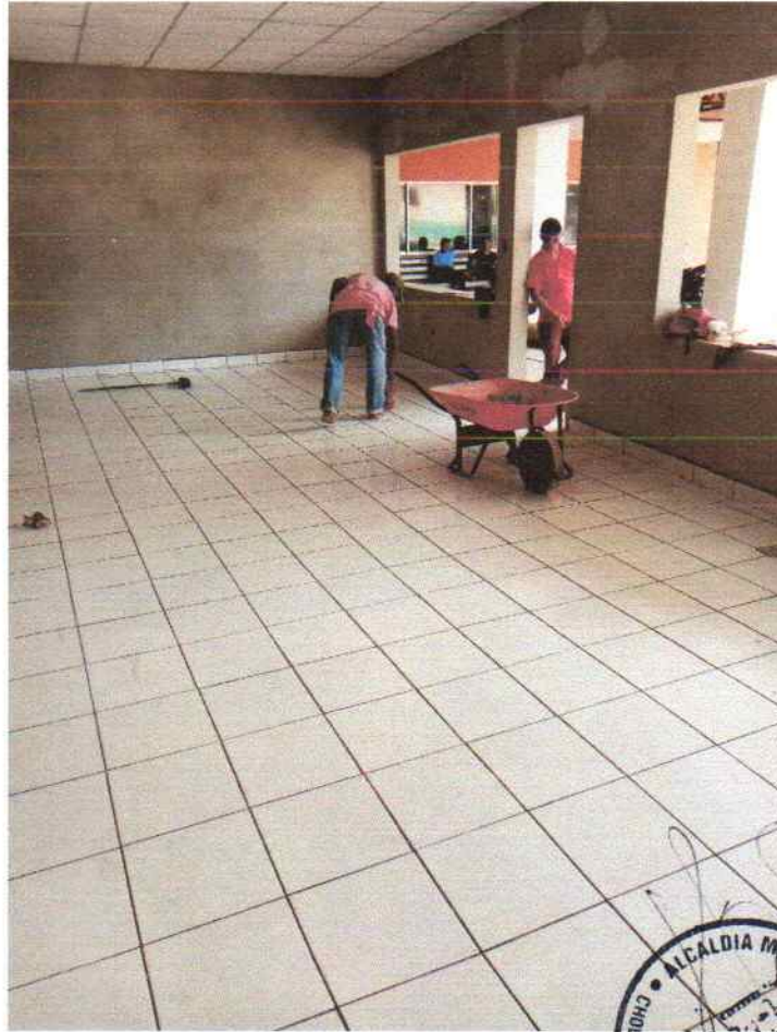
Instalado el piso