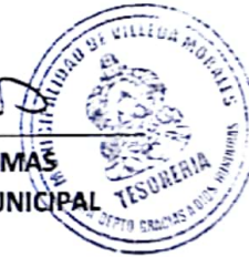
SORAIDA TOMAS TESORERA MUNICIPAL