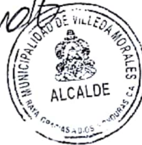
CESAR ARRECHAVALA GALINDO ALCALDE MUNICIPAL