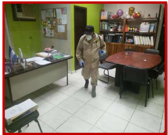
Toma de temperatura corporal al personal, sanitización y fumigación de áreas comunes de las instalaciones como protocolo de medidas de prevención del Covid-19.