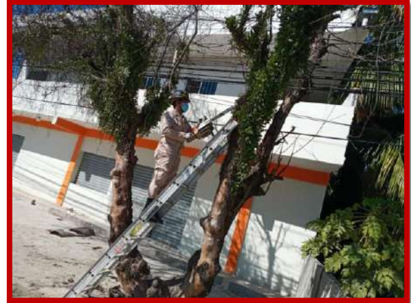
Corte y fragmentación de árbol que representaba riesgo a tendido eléctrico en calle principal del Barrio el Porvenir.