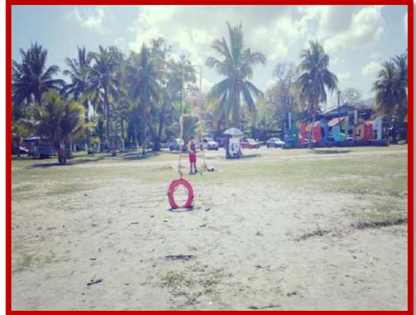
Seguridad humanitaria, primeros auxilios y rescate acuático a visitantes en la playas y balnearios municipales.