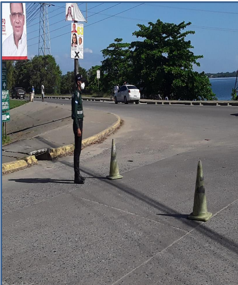
OPERATIVOS DE SEGURIDAD Y CONTROL DENTRO DEL MUNICIPIO