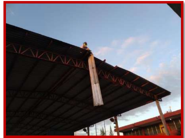
Apoyo a labor social retirando lamina de techado en condición insegura en el Centro Básico Reginal H. Hamer del Barrio Campo Rojo.