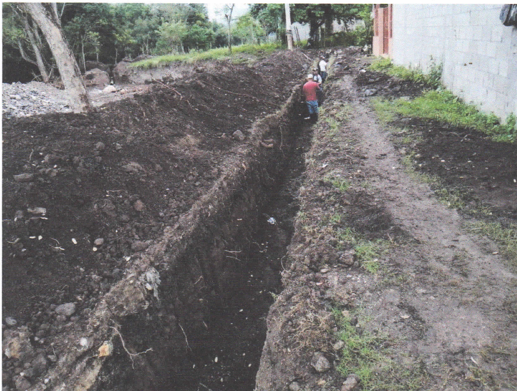
ANTES - DESPUÉS