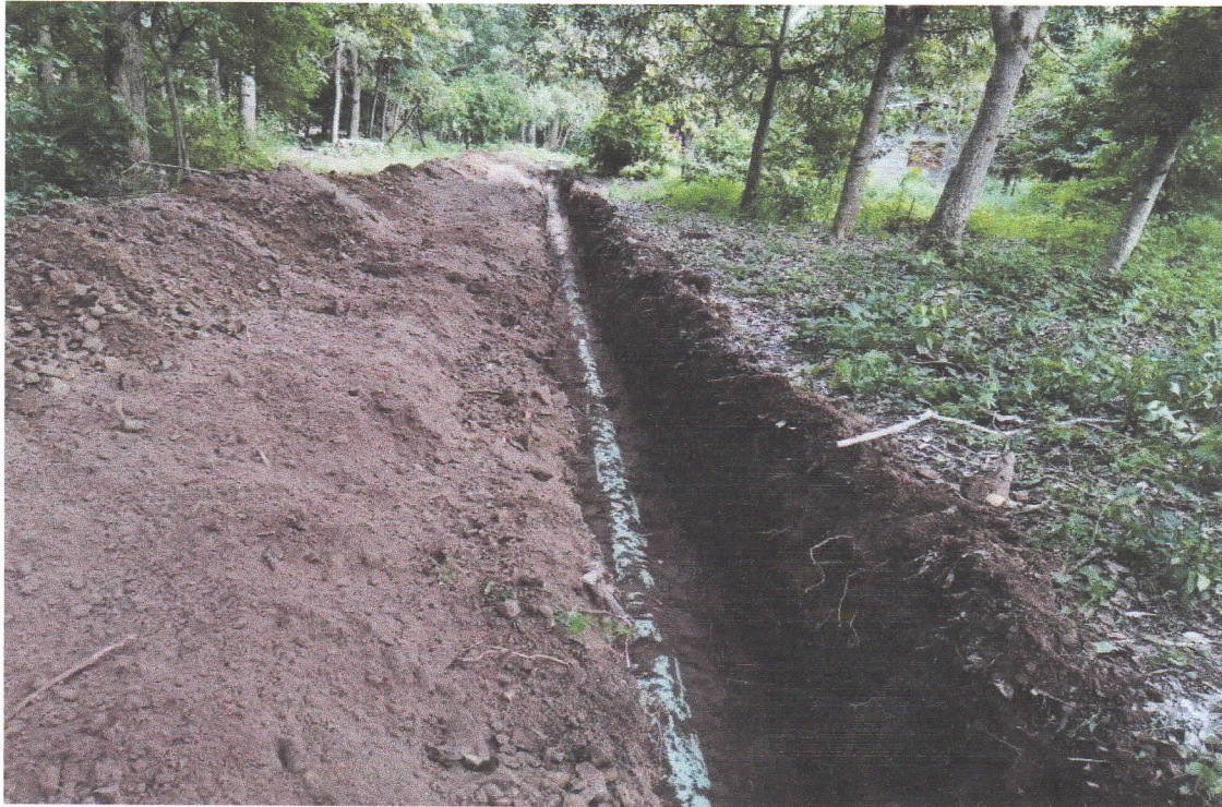
ANTES - DESPUÉS