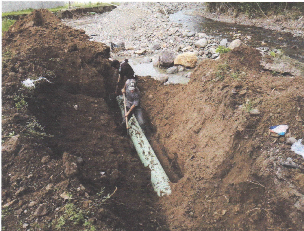
ANTES - DESPUÉS