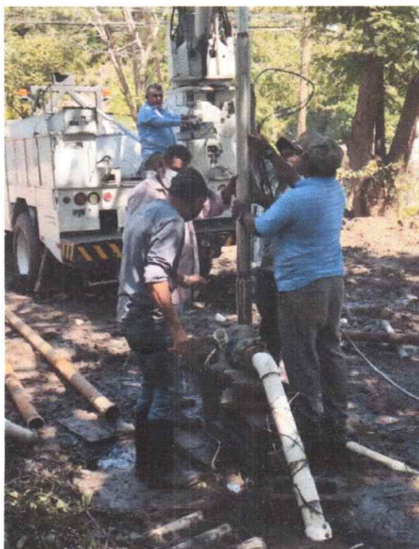
16.Electromecánica instalación de equipo sumergible de 7.5 HP El Calan.