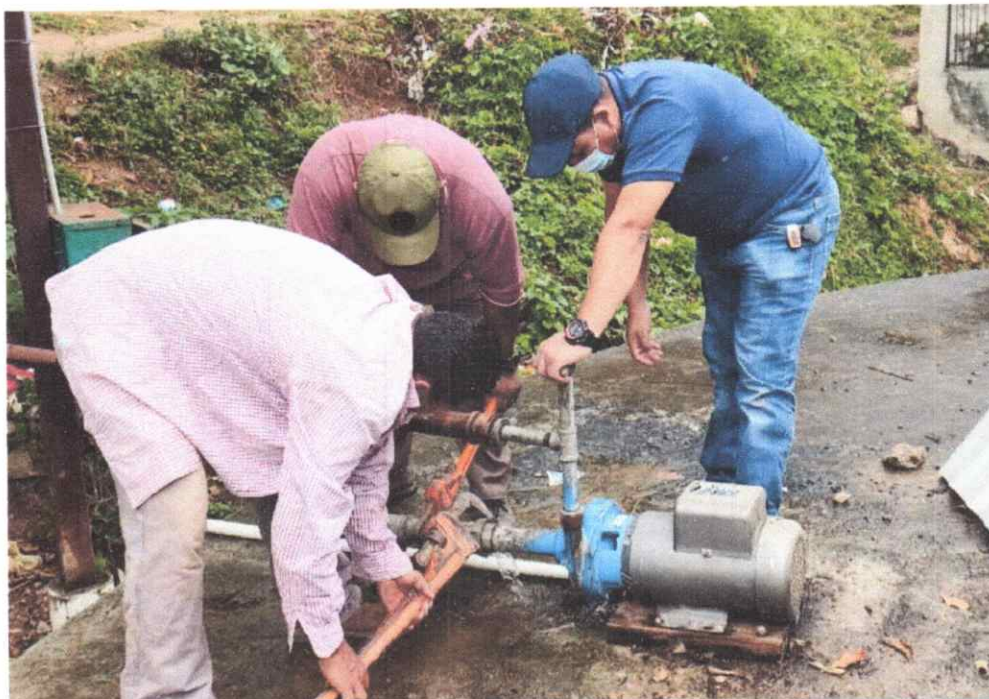
18. Electromecánica instalación de gabinete y puesta en marcha de Pozo Brisas del Calan.