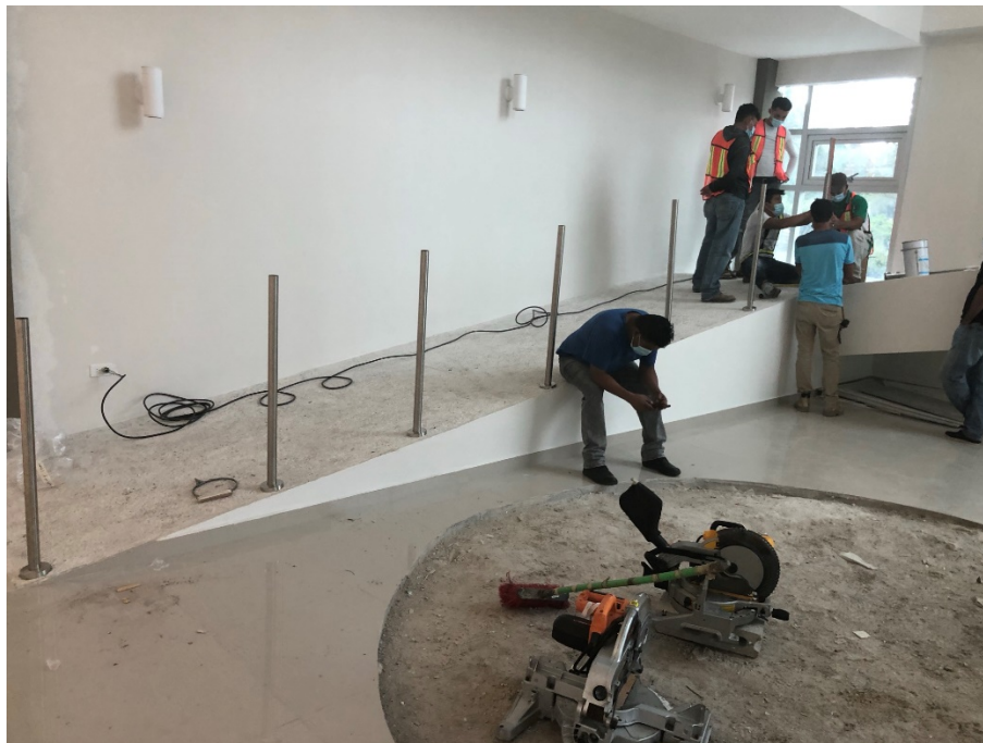
Imagen 1. Instalación de barandales en rampa

Este mes continuó de muros cortina y barandales en el edificio de aulas 50 Aniversario: