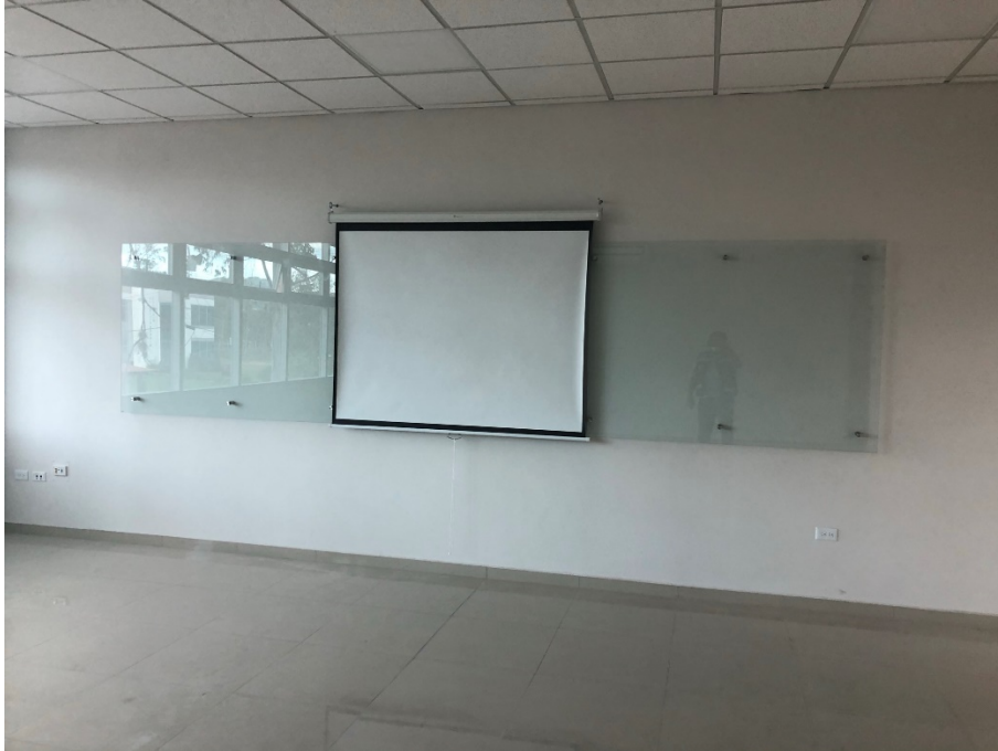
Imagen 7. Instalación de Pizarras de Vidrio.