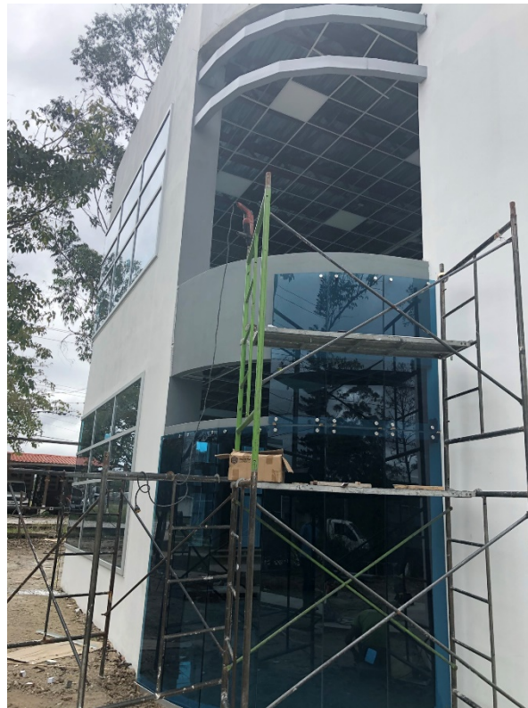
Imagen 3. Instalación de muros cortinas tipo araña.