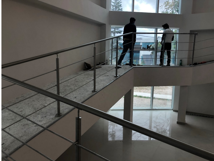
Imagen 2. Instalación de barandales en rampa.