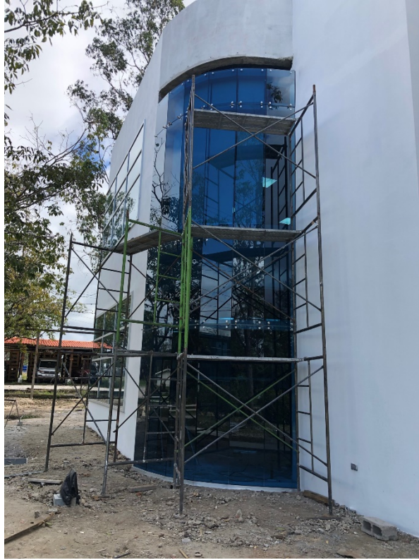
Imagen 4. Instalación de muros cortinas tipo araña.