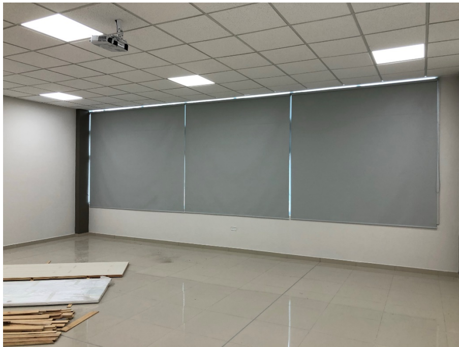
Imagen 5. Instalación de cortinas Black Out.

Este mes se realizó la instalación de Datashows, Cortinas y Pizarras en el edificio de aulas 50 Aniversario: