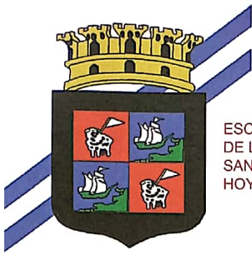
ESCUDO DE ARMAS DE LA CIUDAD DE SAN JUAN PUERTO CABALLOS HOY PUERTO CORTÉS