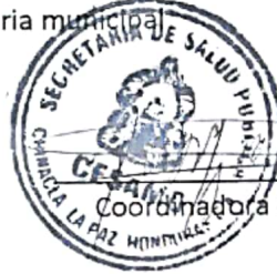
COORDINADORA DE SALUD