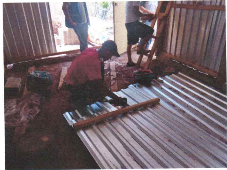
Reparación de baños